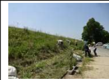
↑公民館東側の土手で草を刈ります。ジャコウアゲハの生態も観察できます。

公民館からお願い ※文化祭当日はなるべく公共交通機関を使って公民館までおこしください。 ※10月19日(木)~23日(月)は準備・片付けのためクラブ講座・部屋貸しはお休みします。