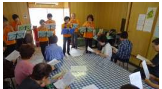
くオカリナフレンズ く東幸町サロンにて

なお、大変恐縮ですが、10月末日をもって退職いたします。半年という短い期間でしたが、大変お世話になりました。