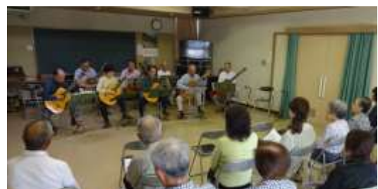
くギター く金岡健康サロンにて